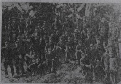
ロングランストを決行した24回生たち= 卒業アルバムから